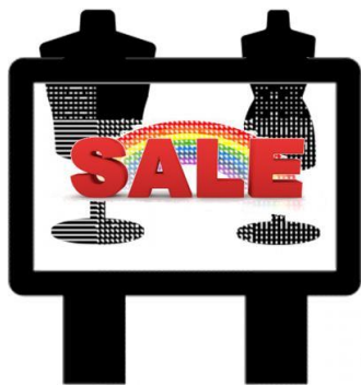
デジタルサイネージ