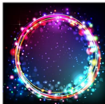
専用の映像コンテンツなど

<お問い合わせ先> 販売元: 大王製紙株式会社 〒102-0071 東京都千代田区富士見 2-10-2 飯田橋グランブルーム 24F TEL03-6856-7548、03-6856-7545 http://www.daio-paper.co.jp 製造元: エリエルテクセル株式会社 〒509-0246 岐阜県可児市今東山 677-1 http://www.e-texel.jp