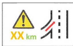
ヘッドアップディスプレイ